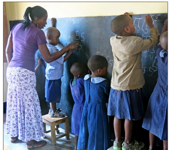
På IDC:s förskola ägnas mycket tid åt skolförberedande lekar och övningar, t ex med siffror och bokstäver.

Sedan flera år driver IDC ett nätverk med 15 kommunala förskolor. Syftet är att utbyta erfarenheter och att diskutera vägar att påverka myndigheterna att förbättra förhållandena på de kommunala förskolorna. Dessutom har IDC vid flera tillfällen ordnat fortbildningsseminarier för förskollärarna i nätverket. Seminarierna har varit